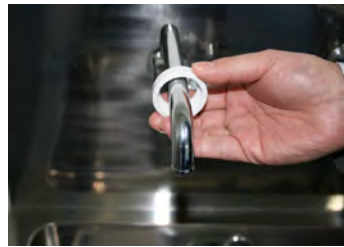
② 取付ナットを蛇口に通します。