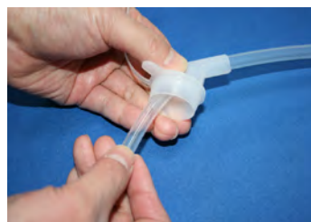
② 逆止弁付ホースをタンク付属アダプタに通します。 (根元までしっかりと通します。)