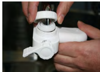
⑥ S-MIX 希釈器本体を蛇口にあてて、上から取付ナットを回して S-MIX 希釈器を蛇口に固定します。