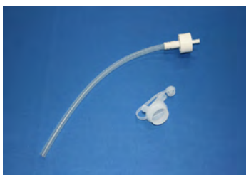
① 2リットルタンクから付属アダプタを外します。