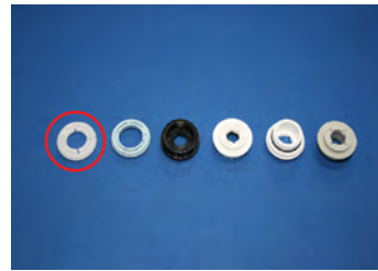
③ 蛇口にあう取付アダプタを使用します。 ※写真は 16mm アダプタ使用例です。 ほとんどの蛇口がこのタイプです。