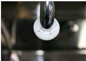
⑤ アダプタの溝の凹みがある方が上になります。