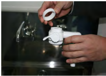
① S-MIX 希釈器本体の取付ナットを外します。