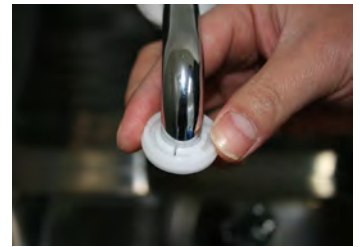
④ 蛇口の先端に取付アダプタをセットします。